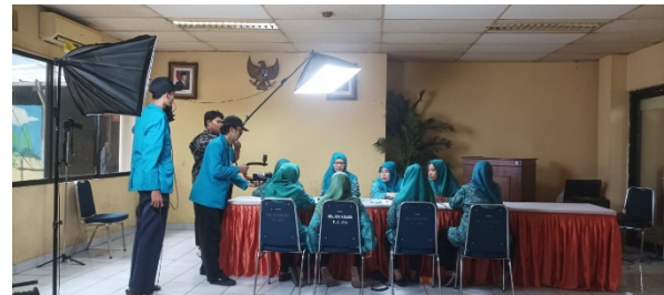
Gambar 2. Proses Syuting

Roa Malaka. Kegiatan tahap ini dilaksanakan pada tanggal 31 Oktober 2024 di Kantor Sekretariat Tim Penggerak PKK yang berada di dalam Kantor Kelurahan Roa Malaka. Kegiatan survey dilakukan oleh ketua tim pelaksana kegiatan didampingi anggota mahasiswa dengan dihadiri oleh Kasie Pemerintahan Kelurahan Roa Malaka dan Sekretaris Tim Penggerak PKK. Hasil kegiatan berupa surat permohonan dari Kelurahan (gambar 1) dan storyboard rencana pengambilan gambar.