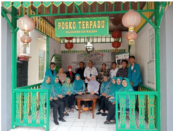
Gambar 5. Foto Bersama tim pelaksana abdimas dan mitra kegiatan

Kegiatan ini dilakukan pada tanggal 7 Nopember 2024 di Kantor Kelurahan Roa Malaka antara ketua tim pelaksana kegiatan pengabdian dengan ketua tim penggerak PKK ditutup dengan foto bersama seperti terlihat pada gambar 5.