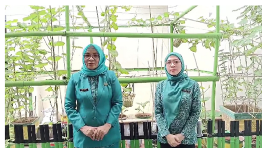
Gambar 4. Syuting Kata Sambutan Ketua Tim Penggerak PKK

Pada hari kedua syuting yaitu pada tanggal 4 Nopember 2024, pengambilan gambar dilakukan untuk kata sambutan ketua tim penggerak PKK Kelurahan Roa Malaka dan Sekretarisnya seperti terlihat pada gambar 4.