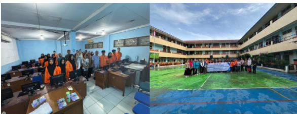
Gambar 1. Dokumentasi kegiatan

Berikut ini disajikan beberapa dokumentasi kegiatan workshop pelatihan kewirausahaan dan digital marketing .