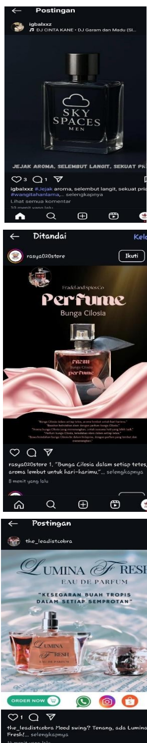
Gambar 3. Hasil Konten Karya Siswa

Dengan adanya kegiatan Pengabdian Kepada Masyarakat dengan tema Pemanfaatan Canva Berbasis Artificial Intelligence untuk Peningkatan Kompetensi Digital marketing bagi Siswa Siswi SMK Al